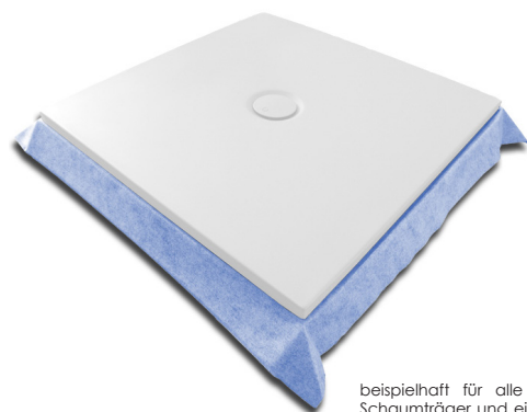
beispielhaft für alle LINEA Duschwannen mit Schaumträger und eingeschäumtem Dichtband

Duschebene aus gegossenem Sanitäracryl - 4 mm, 2-fach verstärkt mit durchgängigem Bodenbrett und Wannenrandverstärkung, für bodenbündigen Einbau, gefertigt nach DIN EN 14527.